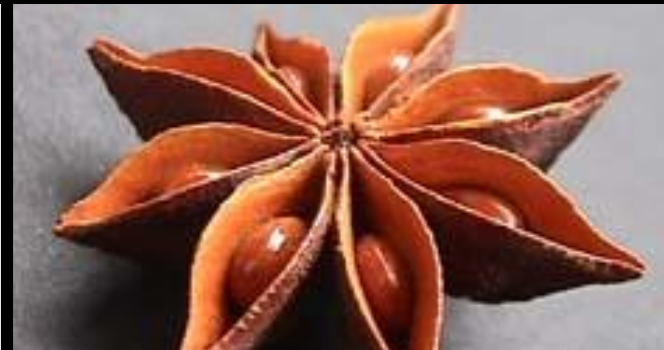
Illicium verum "anís estrellado" China