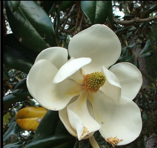
Magnolia grandiflora "Magonolia" - Am. del Norte