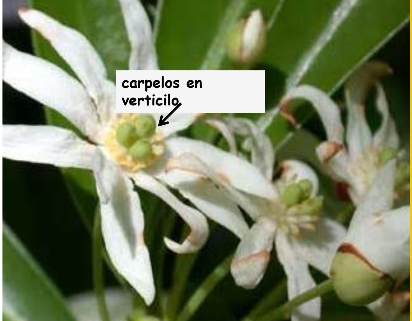
* Drymis winteri "canelo" - Prov. Subantártica Medicinal (corteza antiescorbútica)

Winteráceas: leño con traqueidas (sin vasos)