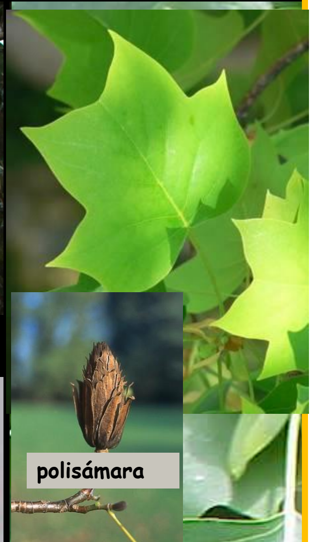
Liriodendron tulipifera "tulipanero" - Am. Norte