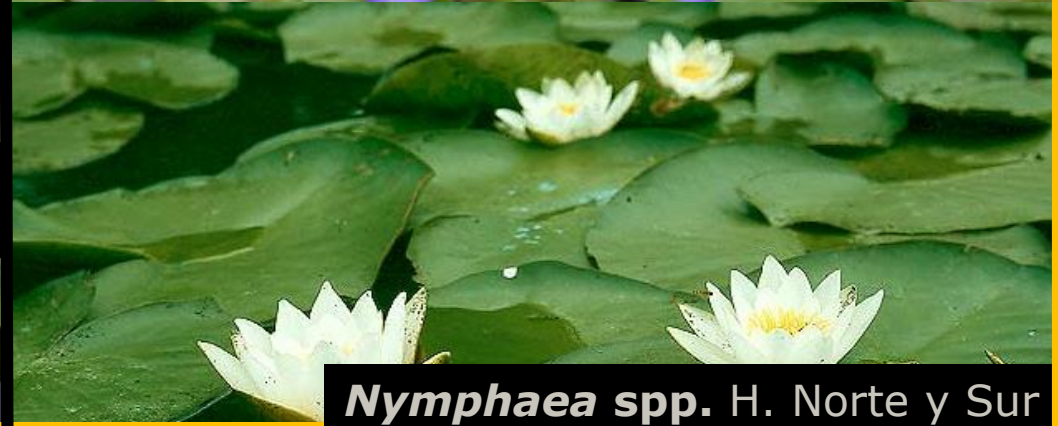
Nymphaea spp. H. Norte y Sur

Ninfeáceas: flores con con K y C conspicuas