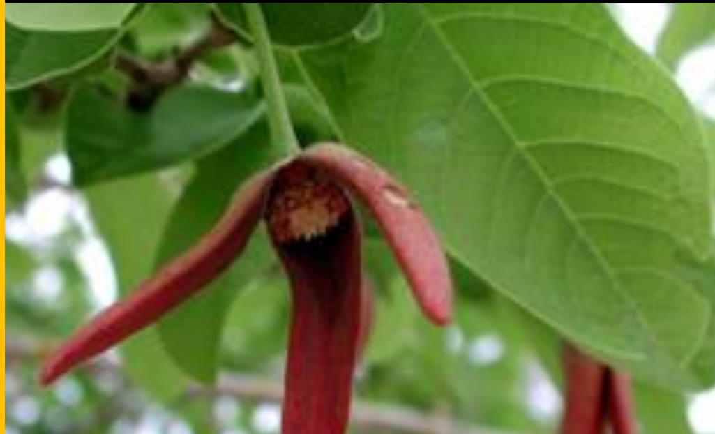
Annona cherimola "chirimoya" - Andes de Perú y Ecuador -