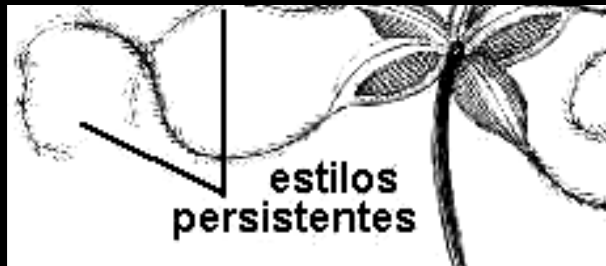
* Clematis spp. "cabello de ángel" Medicinal (antirreumática y antivenérea)