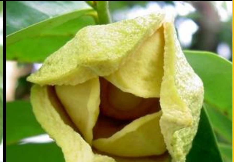
Annona muricata "guanábana" - América tropical -